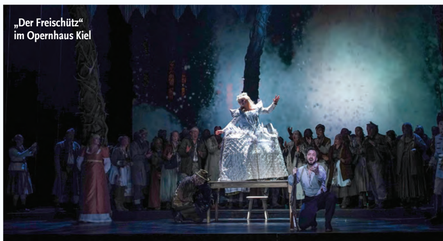
„Der Freischütz“ im Opernhaus Kiel